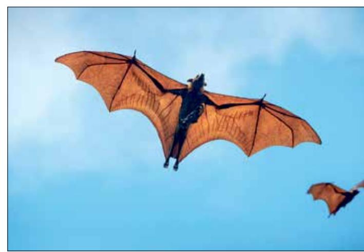
L'allaitement n'est pas réservé au genre féminin. Chez les renards volants, certains mâles (photo) s'en chargent aussi.