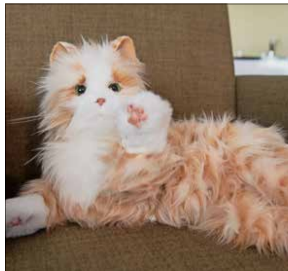
Régler la position d'un lit ( en haut et en bas à gauche ), laver efficacement les dents ( au milieu en haut ), prévenir l'incontinence urinaire ( en haut à droite ) ou trouver du réconfort auprès d'un chat sans risquer un coup de griffe ( en bas à droite ), les technologies présentes dans l'appartement témoin ciblent toute sorte de difficultés liées à la vieillesse.

chambre, copie de celle d'un EMS, des protections sont habilement cachées autour du lit. Un système de caméra permet de voir quand le résident se lève ou sort de la pièce. Les images sont floutées afin de ne pas porter atteinte à l'intimité.